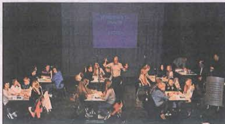
HVEM ENDER I FINALEN? Det er meget jevnt i toppen etter første runde av 5 rette. Bildet viser finalen i Askim

Svarene blir samlet inn igjennom læreren og registrert på nettstedet til 5 rette. Besvarelse blir offentliggjort hver fredag innen klokken 16.00 på små-