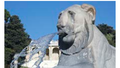
En stor og sterk hunnløve fra Egypt vokter obelisken på Piazza del Popolo