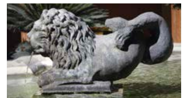
Et fabeldyr, en krysning mellom en løve og en fisk, som selv ikke i kunstens verden har vist seg å være en levedyktig art. Den holder til på en gårdsplass ved Bibelinstituttet i Via della Pilotta.

Listen er lang. Her er noen av dyrene man kan treffe på: Løver, krokodiller, ulv, hjort, det kryr av delfiner, skilpadder, slanger, svaner, kjempeblekksprut, hest og sjøhest, drager, ørner, elefant, bjørn, hund, gris, bier, påfugl, frosk. I tillegg kan man møte mytologiske figurer som tritoner, silen, najader, fauner, sfinx, diverse himmelske vesener og fabeldyr. Safari er absolutt en dekkende betegnelse